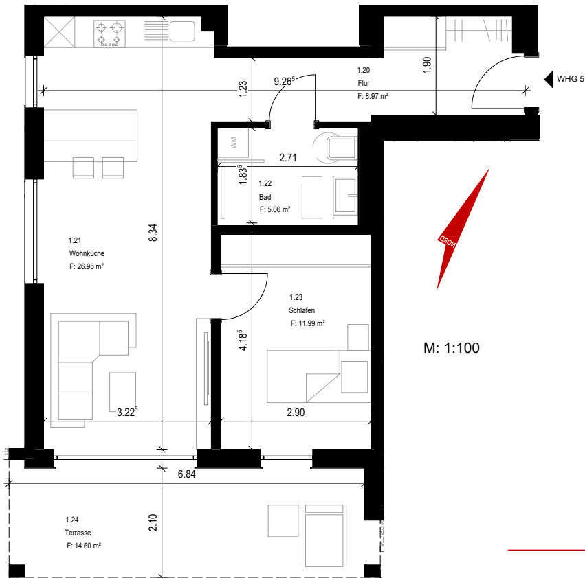
Lage im Gebäude